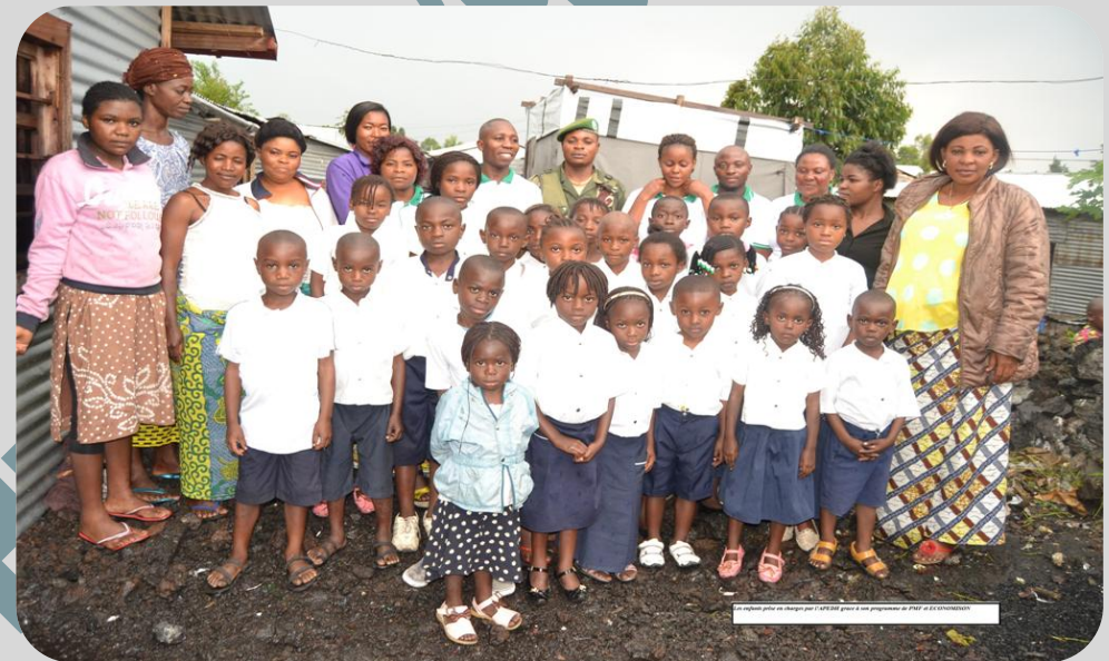
Les enfants plus en charge par l'APEDH grâce à son programme de PAF et ECONOMISONS

814-852-765 E-Mail : info@apedh-assoc.org