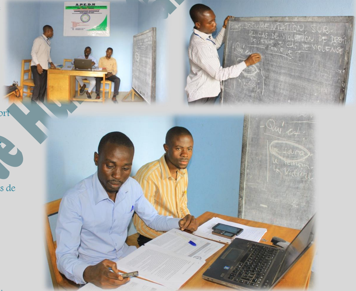
Figure 13 les membres de l'APEDH en étude et évaluation des activités en cours

L'Action pour la Paix, Education et la défense des Droits Humains, APEDH a e: N°019 aven Cagephare ; Q /Virunga ; Com/Karisimbi ; Ville de Goma ; P