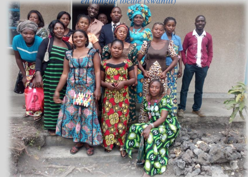
Figure 7 A la sortie de l'atelier sur le crédit et épargne avec les femmes du territoire de Nyiragongo