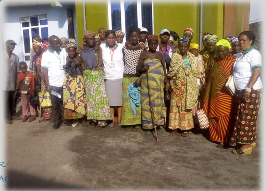
Figure 4 l'APEDH apportés son Assistance aux personnes de 3ièm âge de la ville de Goma

814-852-703 E-Mail : imro@apedh-assoc.org