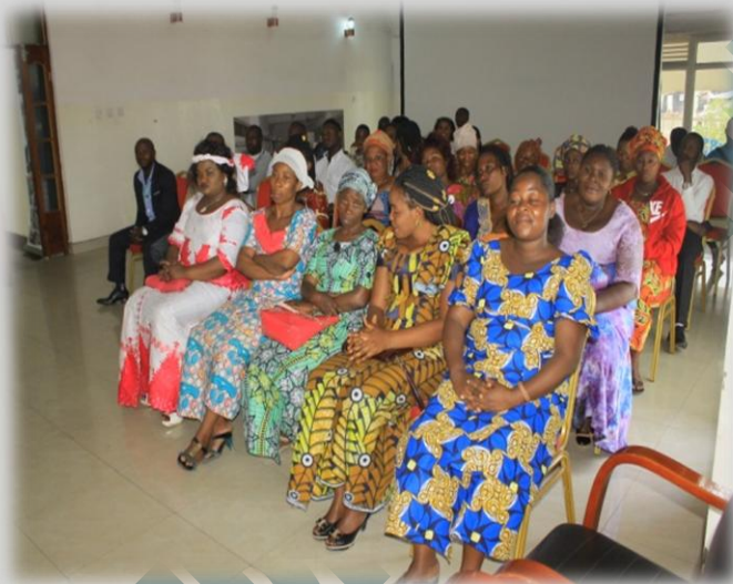
Figure 11 Femmes en attente de réception de leurs certificats