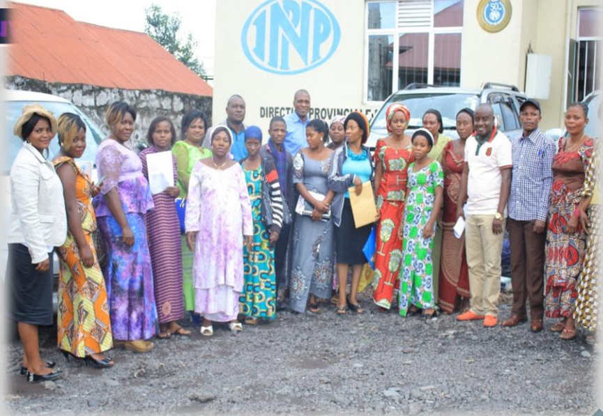
Figure 1 les femmes à la sortie de salle de formation après le jury sur l'entrepreneuriat