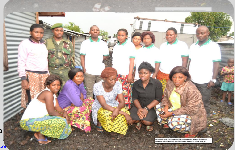
Les Membres de l'APEDH ensemble avec quelques parents des enfants scolarisés par l'APEDH via son programme de PAF et ECONOMISONS