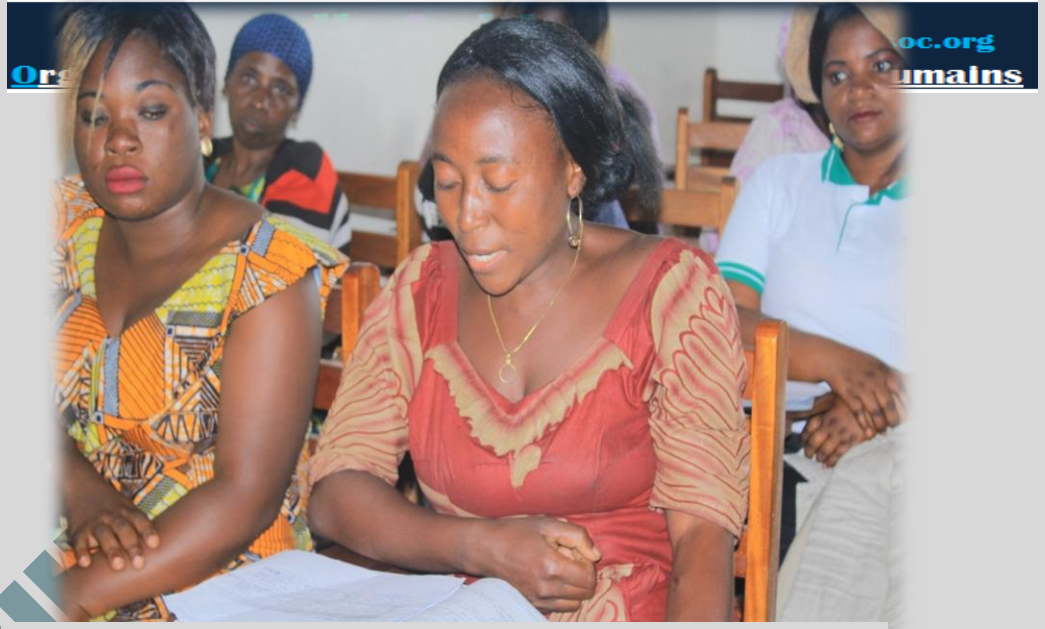
Figure 2 les femmes en pleine formation en entrepreneuriat