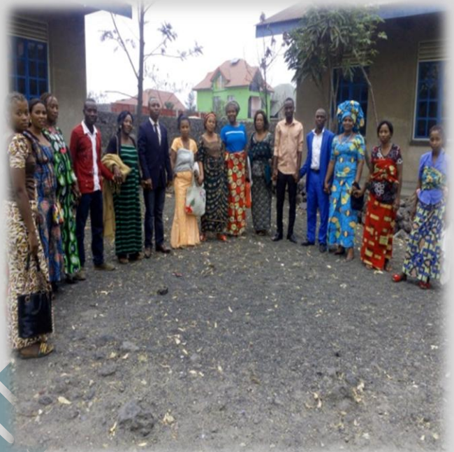
Figure 10 Femmes manifestent leur solidarité