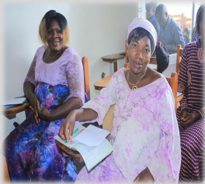
Figure 9 Femmes en pleine formation