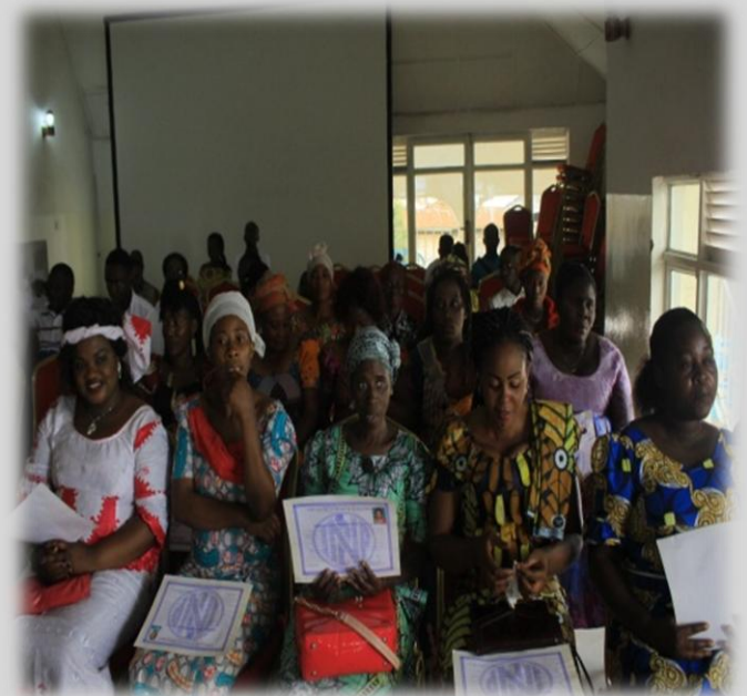
Figure 8 L'APEDH en pleine dépistage du VIH/SIDA à l'hôpital militaire de Goma

L'Action pour la Paix, Education et la défense des Droits Humains, APEDH a exécuté ses activités l'appui de quelques membres de soutiens. Sis sur N°019 aven Cagephare ; Q /Virunga ; Com/Karisimbi ; Ville de Goma ; Province du Nord Kivu RD Congo - Goma - 2019/09/27 1926-713;(0)-814-852-765 E-Mail : info@apedh.org