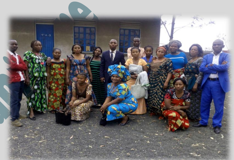
Figure 6 les femmes vulnérables en pleine jury test en langue locale (swahili)

814-852-765 E-Mail : info@apedh-assoc.org Site Web: www.apedh-assoc.org